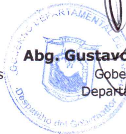
Abg. Gustavo Miranda Villamayor Gobernador Interino Departamento de Itapúa